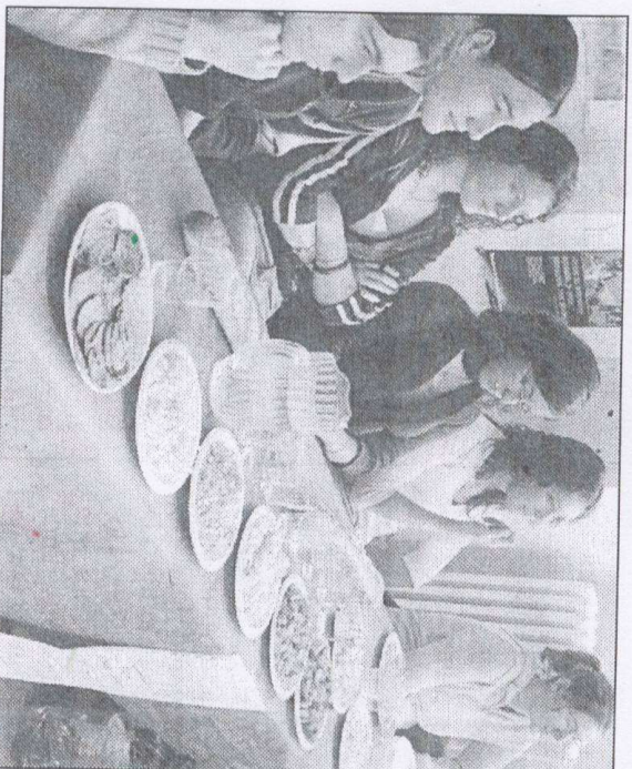
LYCEE LA BRETONNIERE DE CHAILLY, HIER MIDI. La table opulente des pays industrialisés face à celle du monde asiatique.

L'expérience proposée par l'association Starting-block est édifiante. On sent la colère dans les paroles de Charlotte quand elle lance : « Je savais qu'il y avait un déséquilibre entre les peuples, mais pas à un tel point. Que les pays industrialisés gardent tout pour eux, c'est dégueulasse. » Dans l'opération organisée par les animatrices de Starting-block